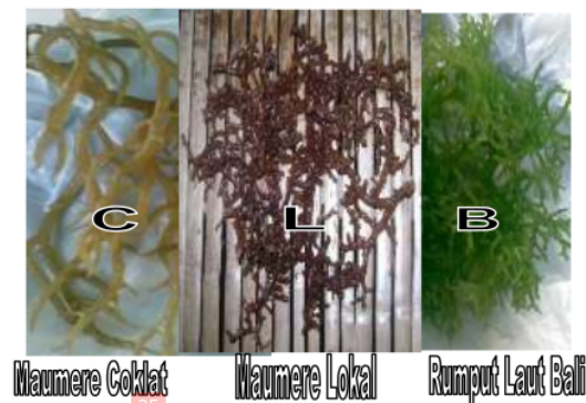
Gambar 2. Varietas Rumput Laut Yang Digunakan Sebagai Perlakuan

Penelitian ini dirancang dengan menggunakan rancangan percobaan pola faktorial, yang terdiri dari dua faktor yaitu varietas dan kedalaman. Masing-masing faktor terdiri atas 3 taraf sehingga terdapat 9 kombinasi perlakuan dan setiap kombinasi perlakuan diberi 3 ulangan, sehingga terdapat 27 unit percobaan.